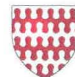
AVANT QUE LA MER FUT AU MONDE ROCHECHOUART PORTAIT LES ONDES

En ce qui concerne les Trois-Moutiers, le blason que vous pouvez voir sur la première page de ce journal, n'est pas celui du village. C'est un logo, adopté il y a plusieurs années et qui s'est inspiré, en les simplifiant, des armoiries de la famille de Rochechouart. Cette famille eut une grande influence sur la vie de la région au XVII ème siècle, lorsque le marquis François II de Rochechouart, un des grands du royaume, fut contraint de quitter la cour de France et de revenir vivre en province dans son château de la Mothe Chandeniers. Il avait participé à la Fronde contre la régente Anne d'Autriche et son ministre, le cardinal Mazarin, pendant la minorité du roi Louis XIV. Durant son exil, les Trois-Moutiers furent le lieu de fêtes somptueuses où se retrouvaient les plus grandes familles de la noblesse française. Le blason de la famille de Rochechouart représentait trois vagues stylisées, très ondulées, avec cette devise explicative : « Avant que la mer fût au monde, Rochechouart portait les ondes ».